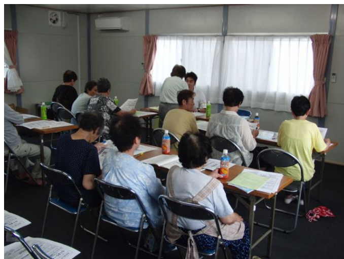
法律相談（共催：ヒューマンライツナウ）